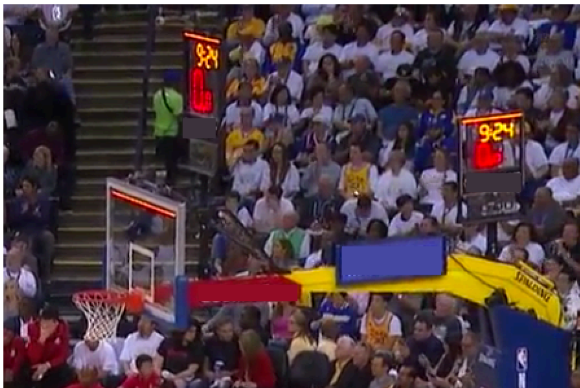
Foto 2. Pozioma linia świetlna w kolorze żółtym

- poziomą linię świetlną w kolorze żółtym, która ma się świecić, tylko wtedy, kiedy brzmi sygnał zegara czasu akcji, i zamontowaną tuż poniżej górnego poziomu sygnalizacji świetlnej w kolorze czerwonym (foto 2 poniżej).